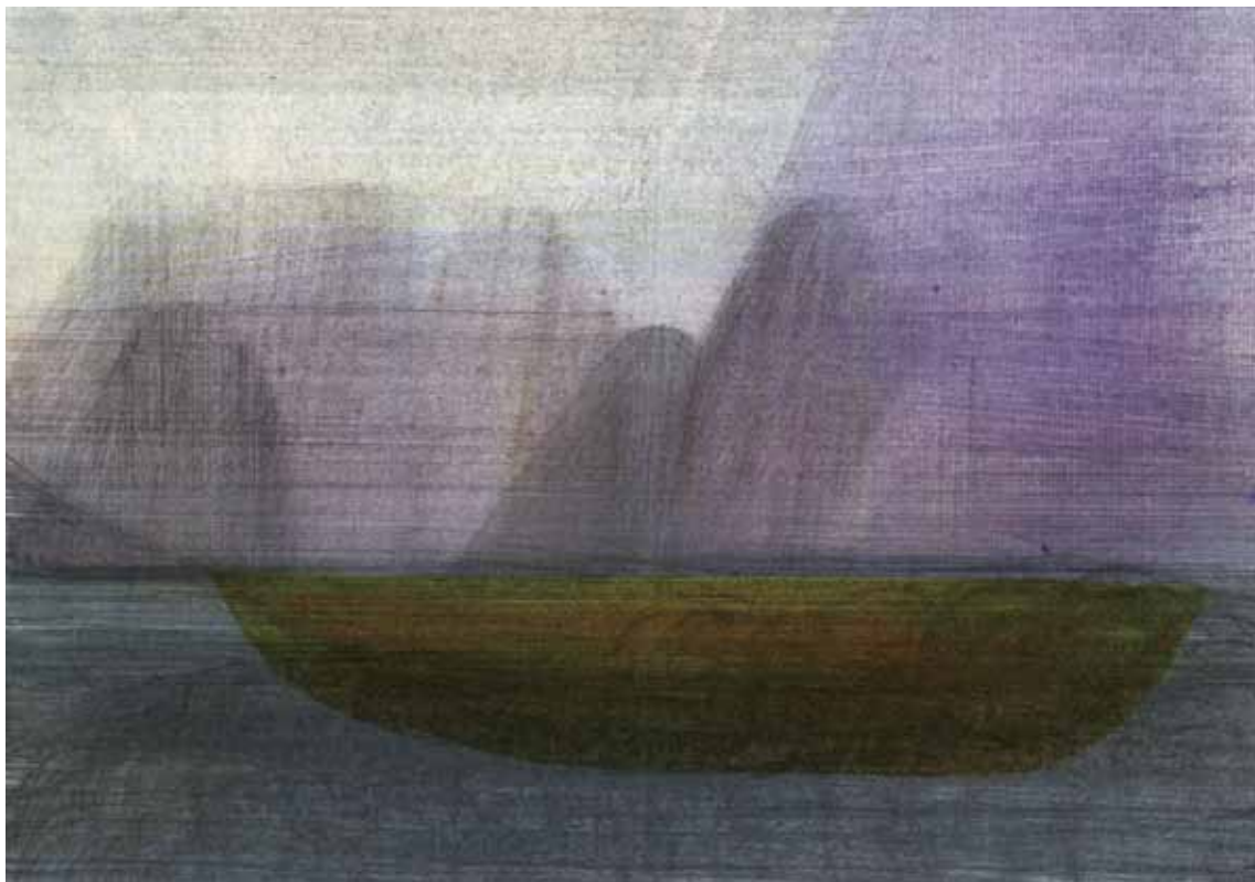
einschiffen II 2011

10,5 × 15 cm, Tusche, Bleistift, Buntstift, Aquarellfarbe auf Papier / ink, pencil, crayon, watercolour on paper