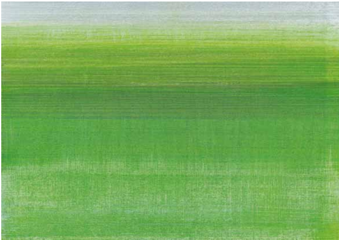
Wasserwiese 2010 10,5 × 15 cm, Tusche, Bleistift, Buntstift auf Papier / ink, pencil, crayon on paper