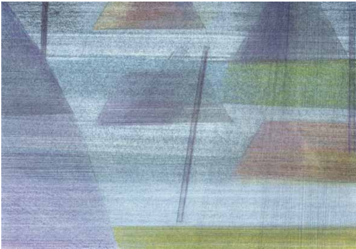
o.T. / untitled 2011 10,5×15 cm, Tusche, Bleistift, Buntstift, Aquarellfarbe auf Papier / ink, pencil, crayon, watercolour on paper