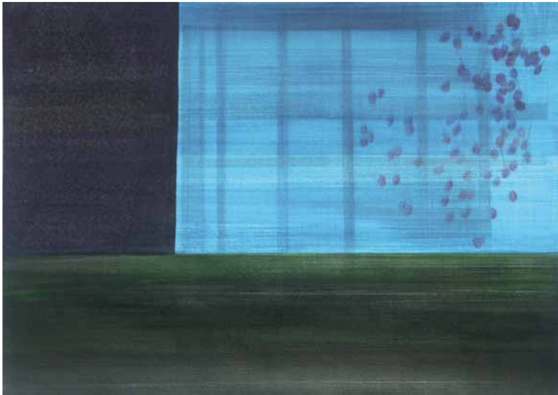
Tränendes Herz 2011 36×51 cm, Tusche, Bleistift, Buntstift auf Papier / ink, pencil, crayon on paper